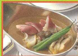
苫小牧ホッキカレー