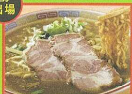
室蘭カレーラーメン