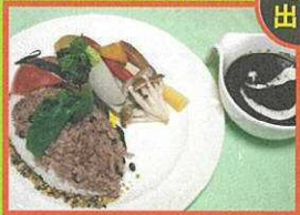
北竜町黒千石カレー