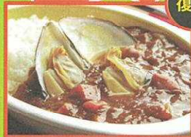
しらおいシーフードカレー