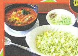
森の恵み しむかっぶ村 山菜カレー